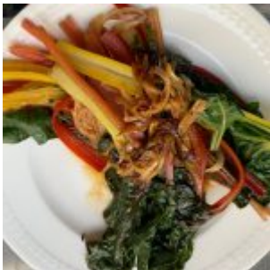
...Mangold etwas abkühlen lassen...