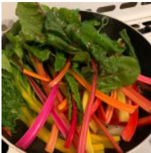
Mangold in der Pfanne anbraten

Den Teig in zwei Portionen teilen. Jede Portion auf einer Plastikfolie zu einem ca. 15×10 cm Rechteck formen. Darauf jeweils 1/2 des gebratenen Mangolds mittig verteilen. Dann den Teig über die Füllung zusammenrollen und die Rolle eng in die Folie einwickeln. Enden eindrehen und alles nochmal in ein Stück Alufolie einwickeln, damit die Rollen im Wasser nicht aufgeht.